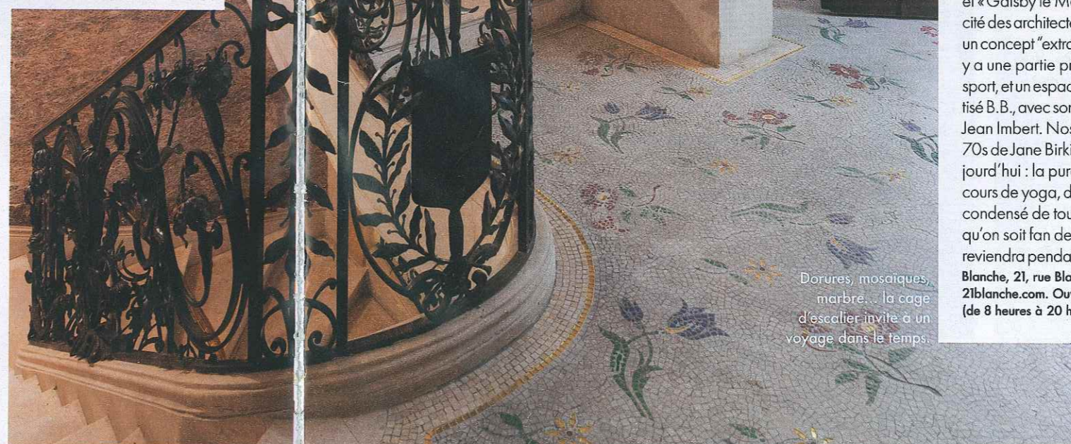
Dorures, mosaïques, marbre... la cage d'escalier invite à un voyage dans le temps.

Pour 4 personnes. Rincez 300 g de riz rond japonais dans de l'eau. Laissez-le égoutter 30 mn, puis faites-le cuire à couvert dans 30 cl d'eau. Au bout de 15 mn, coupez le feu et laissez reposer 10 mn à couvert. Sur feu vif, faites fondre 2 c. à s. de sucre et 1/2 c. à s. de sel dans 4 c. à s. de vinaigre de riz. Laissez tiédir. Versez le vinaigre et 2 c. à s. de sésame torréfié sur le riz encore chaud. Dans les assiettes, décorez le riz de « pétales » de légumes taillés à la mandoline (betterave, concombre, radis, cébettes, asperges, chou rouge) et d'herbes (shiso, pourpier...). Servez avec la sauce ponzu (10 cl de sauce soja + 8 c. à s. de jus de yuzu/orange/citron vert/mandarine + 4 c. à s. de mirin, un saké sucré).